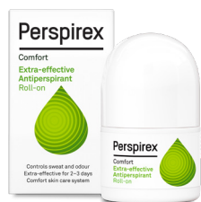
Roll-on 20ml PERSPIREX COMFORT