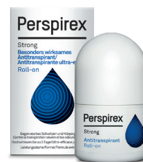
Roll-on 20ml PERSPIREX STRONG

contre la transpiration toujours gênante