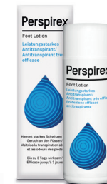
Lotion 100ml PERSPIREX FOOT LOTION

contre la transpiration des pieds (/mains)