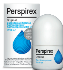
Roll-on 20ml PERSPIREX ORIGINAL

contre la transpiration toujours gênante