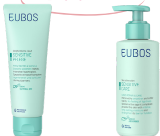
Hand Repair & Care 75 ML