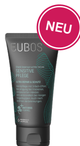
Ultra Hand Repair & Protect 75 ML